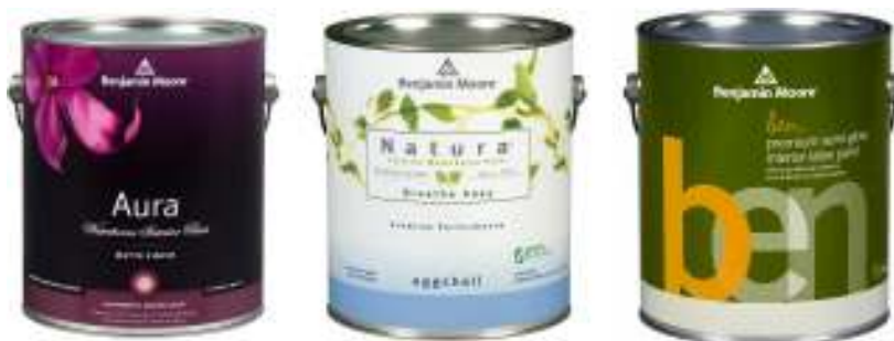
国内新発表のジェネックスシリーズ。左から、AURA、Natura、ben

「Natura(ナチュラ)」、ペイントがはじめての若いお客様にも馴染みやすい「ben(ベン)」。ベンジャミンムーアならではの製品イメージを反映した美しいラベルにもご注目ください。