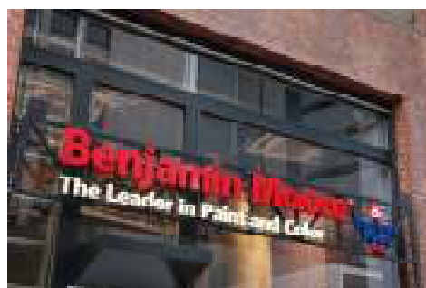
オシャレで目立つ赤が基調のロゴ看板

B.M.ジャパンでは「インテリアの壁を買う」をコンセプトに、海外では当たり前である「ペイントの壁」を日本においてもホームオーナーの皆様に当たり前を選んでいただけるよう、大都市圏を中心に同タイプの店舗拡大を進める予定です。